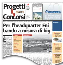
■ L'anticipazione sul n. 26/2010

L'area di intervento è di 40mila mq, la superficie dell'edificio è fissata in 65mila mq. Al vincitore andranno 200mila euro, più i successivi incarichi. Rimborso spese di 35mila euro a tutti gli altri. Candidature entro il 31 gennaio 2011, elaborati entro il 31 maggio successivo.